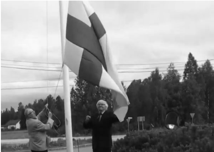
Sukutapaaminen aloitettiin Suomen lipun nostolla