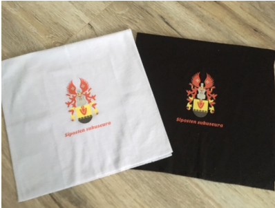
Tuubihuivi 10 € värit musta ja valkoinen