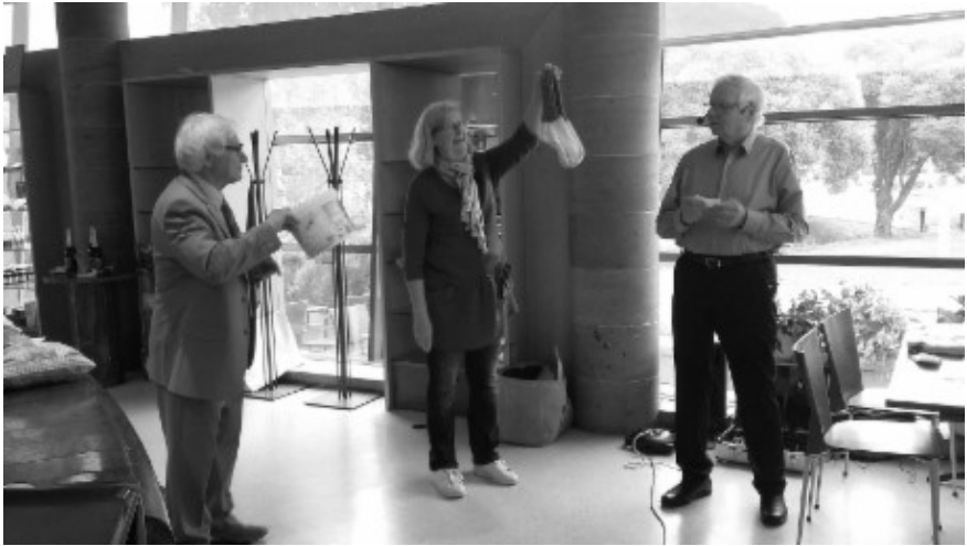
Perinteisissä arpajaisissa jaettiin hienoja palkintoja