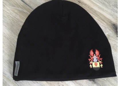
Pipo fleeevuorella 20 € värit musta, pinkki ja harmaa